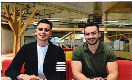
Hrvatski studenti napravili AI modni alat za unikatan dizajn: 'Vjerujemo da svatko zaslužuje nositi svoju ideju'

Pisali smo edukativne članke o mladima, a neke smo prenosili iz drugih medija. Pokrivali smo teme odgoja, školstva, problema s kojima se suočavaju mladi, kao i trendova koji vladaju među mladima danas. Pisali smo i o mladim inovatorima u Hrvatskoj, problemu zapošljavanja i slično.