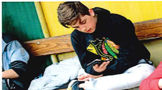
Apel za zaštitu djece u digitalnom dobu: 'Učimo iz australskog primjera'